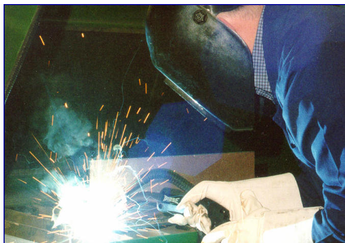
Praca z włączonym odciąganiem